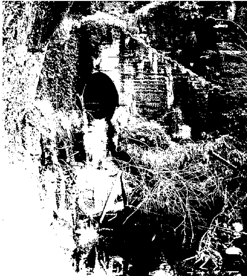
Scempio a Sant'Agnello. Acque reflue sversate in zona a protezione speciale